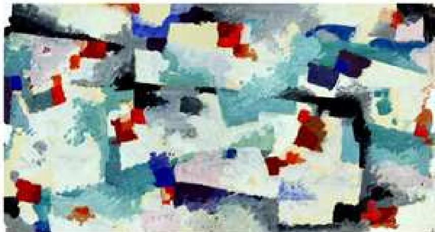
Fred Pittino - astratto - cm 95 x 50