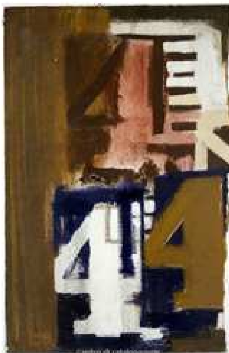
Luciano Biban - composizione astratta - cm 50 x 75